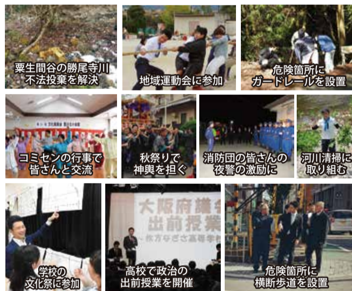
粟生間谷の勝尾寺川不法投棄を解決

府民の皆さんのお困りごとには迅速に対応。信号や横断歩道など道路標識、ガードレールの設置、河川の土砂撤去やゴミの除去、草木の伐採など様々なことを解決させていただきました。また、様々な地域活動への参加、毎週駅頭での府政報告の配布、定期的に街頭演説や街宣車での街宣活動を行い、足を使って皆さんのお声に耳を傾けています。これからも何かお困りごとがございましたら、何でもご相談ください!