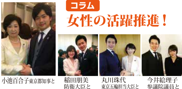
小池百合子東京都知事と 稲田朋美 防衛大臣と 丸川珠代 東京五輪担当大臣と 今井絵理子 参議院議員と