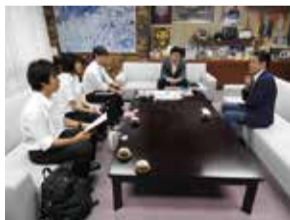
↑インターン生と倉田市長の意見交換

←西尾章治郎 大阪大学総長に、キャンパス移転後の粟生間谷活性化への支援を要望し、快諾を得る