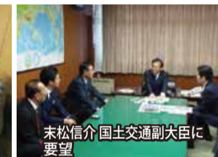
末松信介国土交通副大臣に要望