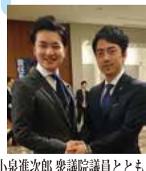
小泉進次郎 衆議院議員とともに

志は、府民ファースト! 不毛な政党間の対立を終わらせて、オール大阪で大阪の発展を!