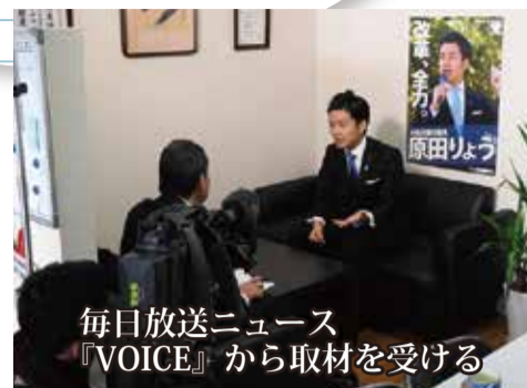
毎日放送ニュース『VOICE』から取材を受ける

議会毎に必ず質問を行い、徹底追及。今年度所属する府民文化常任委員会では、削られ続けている文化予算の振興を求めました。さらに、大阪府のお金の使い道が正しいかを議論する決算特別委員会のメンバーに選ばれ、府のお金が適切に使われているかしっかりと質問。発言する府議会議員として、議会でも全力で活動しています!