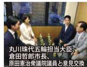
丸川珠代五輪担当大臣、倉田哲郎市長、原田憲治衆議院議員と意見交換